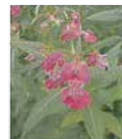
Balsamine de l'Himalaya