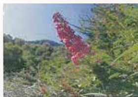
Buddéia (arbre à papillons)