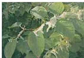
Renouée du Japon

Ces plantes exotiques ont un impact sur la qualité de notre environnement et notre santé. Des mesures de lutte pour leur élimination seront proposées lors de ces rencontres individuelles.